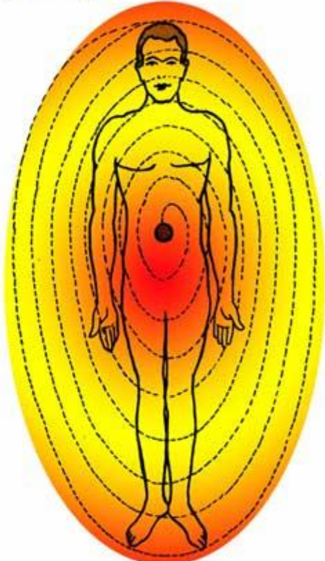
Fire Principle Spiral Currents